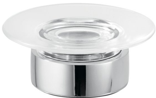
Immagine del prodotto

DOLANO NEW Portasapone da appoggio con bacinella, vetro trasparente