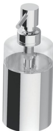
Immagine del prodotto

CHIC14 Distributore di sapone da appoggio, vetro trasparente 0.25 l